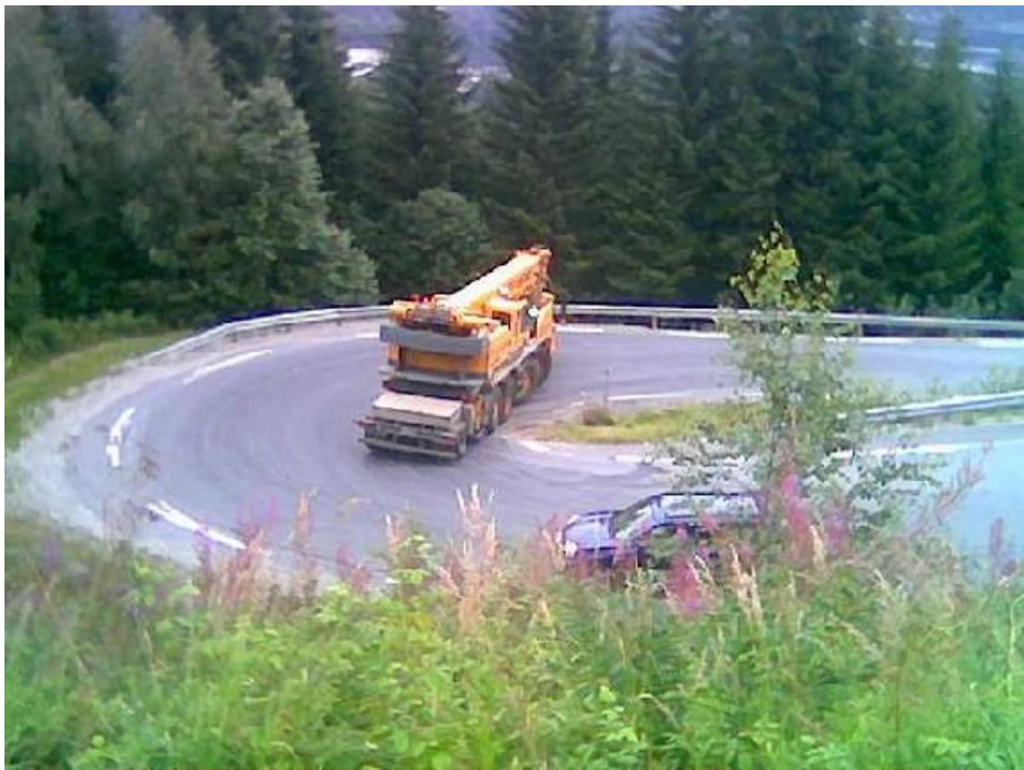
Noen svinger i Telemark og gitt?