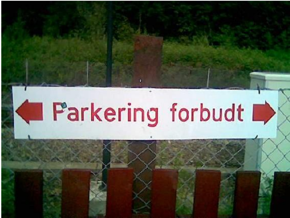
Typisk fra Drangedal sentrum