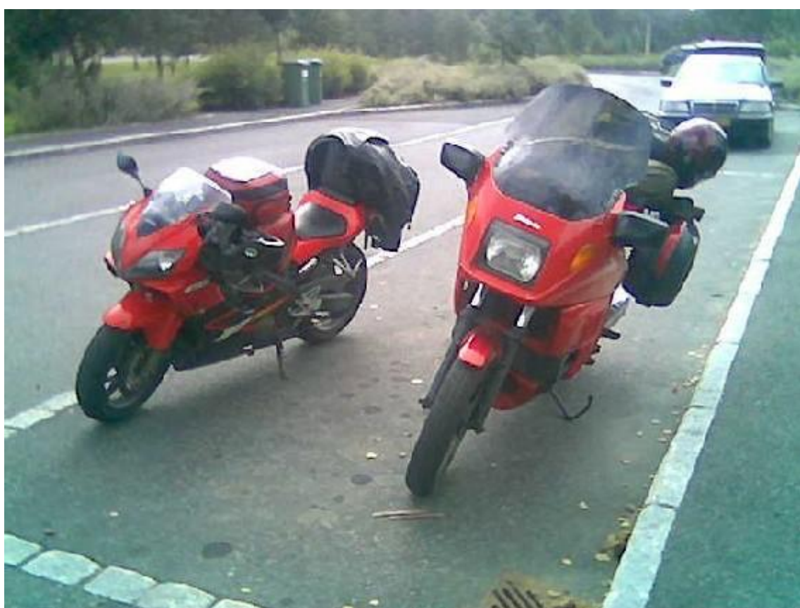
Far og sønn på tur??