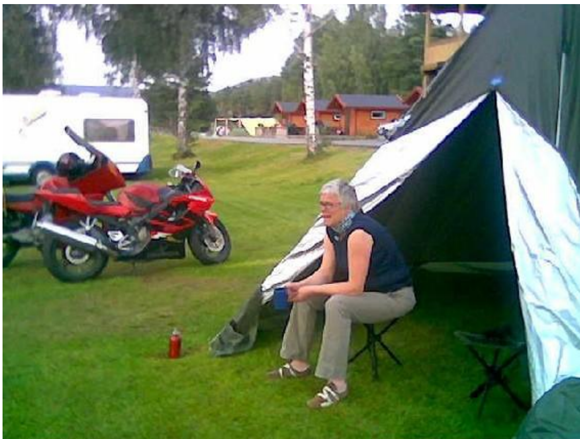
En liten en i en lavvo døra hører ferien til?