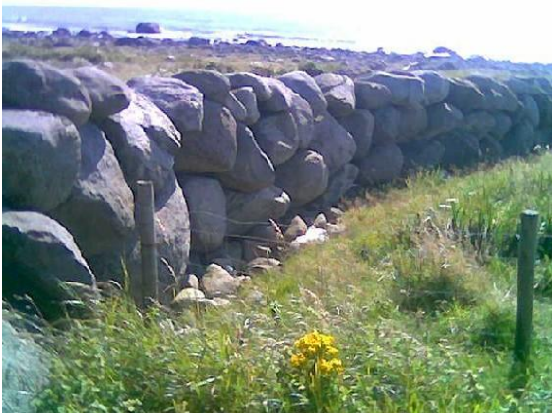
Solide gjerder på Jæren gitt

Publisert av Svend Olsen Tirsdag 7/8-2007 14:51:55