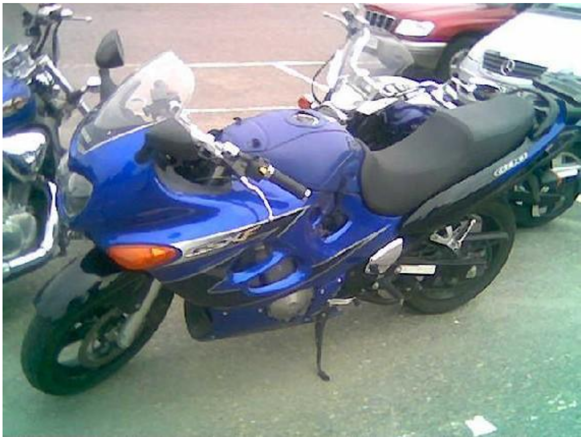
GSX 600 f noe ny, mange fine sykler å se på turen Ikke alle feriesykler er Honda, snodig...:P